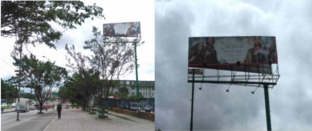
VALLA INSTALADA ANUNCIA SENTIDO SUR - NORTE: CAZADOR Y LA REINA DEL HIELO